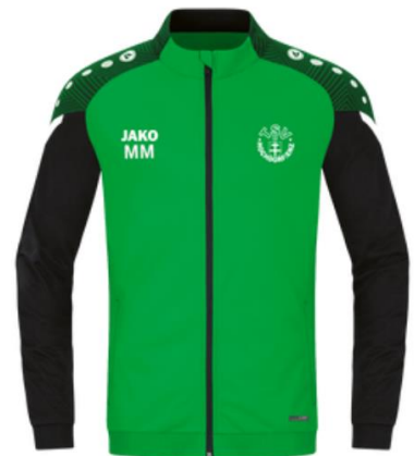
TSV Hochdorf / Enz Polyesterjacke Performance