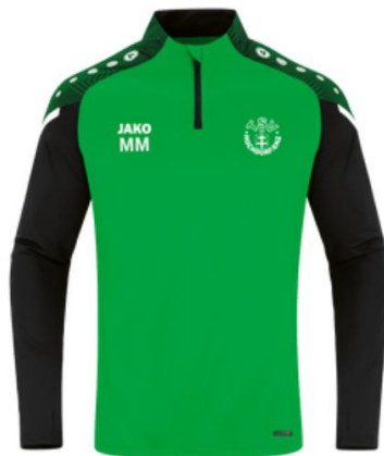
TSV Hochdorf / Enz Ziptop Performance