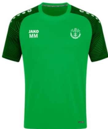
TSV Hochdorf / Enz T-Shirt Performance